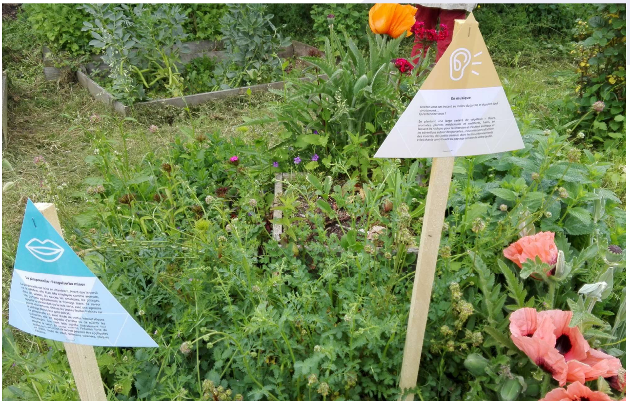
Parcours Eco-errance sur le campus de Marne-la-Vallée